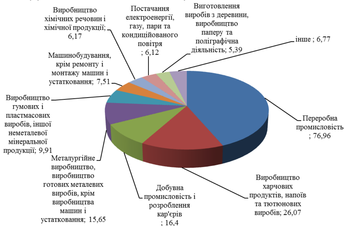
Рис. 2. Структура прямих іноземних інвестицій (акціонерний капітал) в промисловість економіки України станом на 31 грудня 2018 року, млн дол. США 1

поводження з відходами, а також виробництво основних фармацевтичних продуктів і фармацевтичних препаратів. Обидні сфери залучають менше 1% від загального обсягу залучених інвестицій в промисловість.