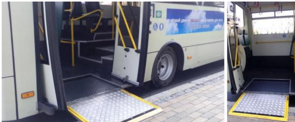
Рис. 3. Низькопідлоговий транспорт (автобус)

Україні зараз діє підприємство, яке випускає автобуси міжміського сполучення з низькопідлоговою вставкою. Спеціально відведене і понижене місце розташовується на задніх дверях автобусу (рис. 3).