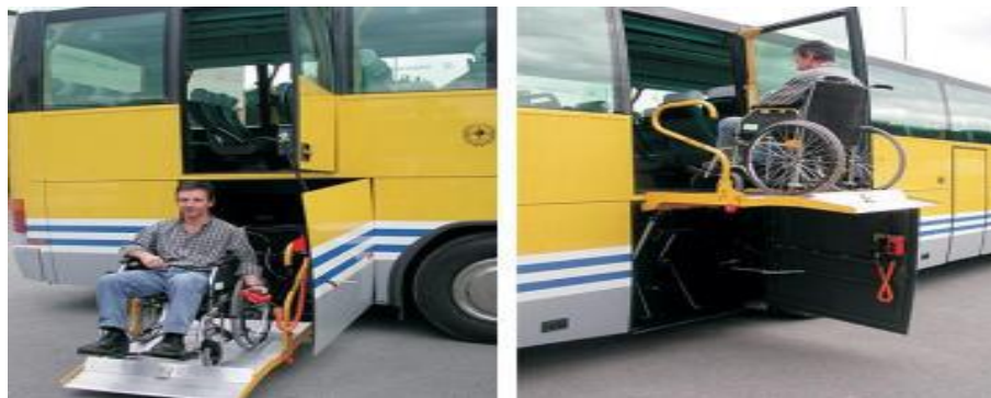
Рис. 4. Автобуси з підйомними платформами

Закордонні аналоги автобусів облаштовують підйомними платформами (рис. 4).