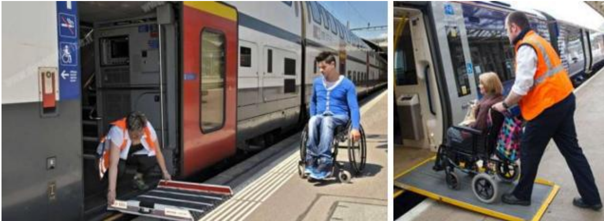
Рис. 10. Облаштування пандусом вагону потяга

рівні входу у вагон, роблять відкидний або переносний пандус (рис. 10).