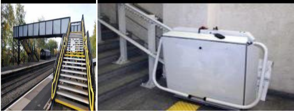
Рис. 7. Потяги з сучасним обладнання

На кожній станції мають бути мнемосхеми з планом приміщення, дубльовані шрифтом Брайля та випуклими написами для людей з порушенням зору. На виході та вході у будівлю вокзалу необхідно встановити