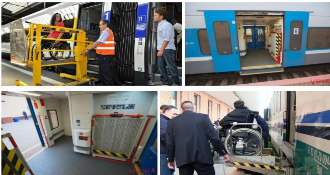
Рис. 11. Зображення рухомих підйомних платформ у вагонах потягу

Особи на інвалідних візках майже завжди зупиняються на суспільній базі. Особи з великими труднощами пересування спорадично зупиняються у приватних квартирах і на нічліжній базі.