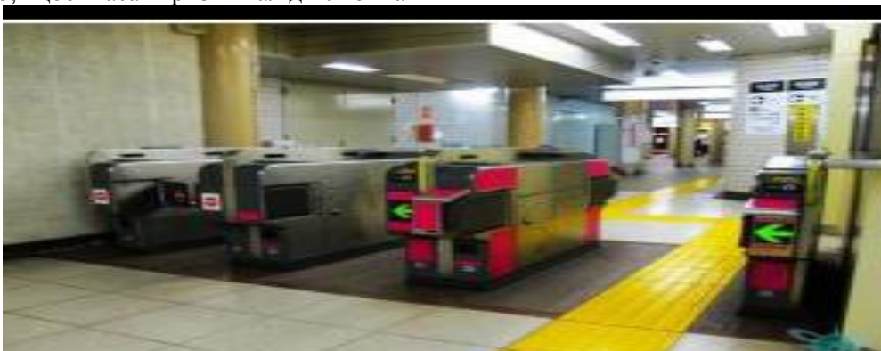
Рис.9. Процес виокремлення квиткової каси для інвалідів

моніторі замовлення бачив дані, які вносить касир (рис. 9).