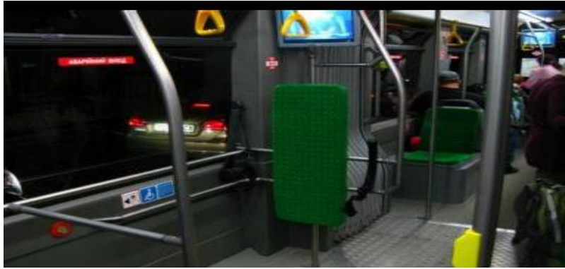
Рис. 2. Облаштування автобусів нового типу для осіб з інвалідністю

У деяких моделях відкидної платформи немає, тому важливо позначати такі машини піктограмою – доступ для людей з інвалідністю, причому як з середини, так і ззовні.