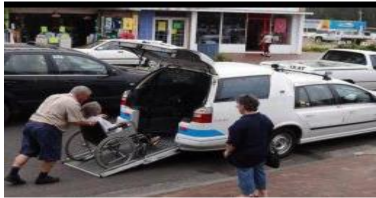
Рис. 6. Облаштування таксі для осіб з інвалідністю

Нині з'являються нові потяги з сучасним обладнанням і курсують старенькі, зі звичними для нас вагончиками, які дозволяють особі з інвалідністю подорожувати без сторонньої допомоги або