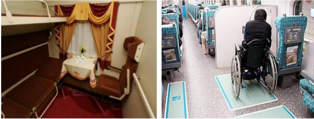
Рис. 12. Облаштування купе для осіб з інвалідністю

або облаштоване спеціальне купе (рис. 12).