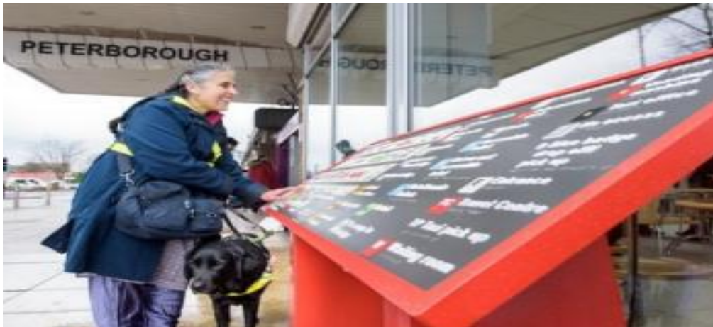
Рис. 8. Мнемосхема з планом приміщення вокзалу

звукові маячки для орієнтування слабозорих чи незрячих осіб (рис. 8).