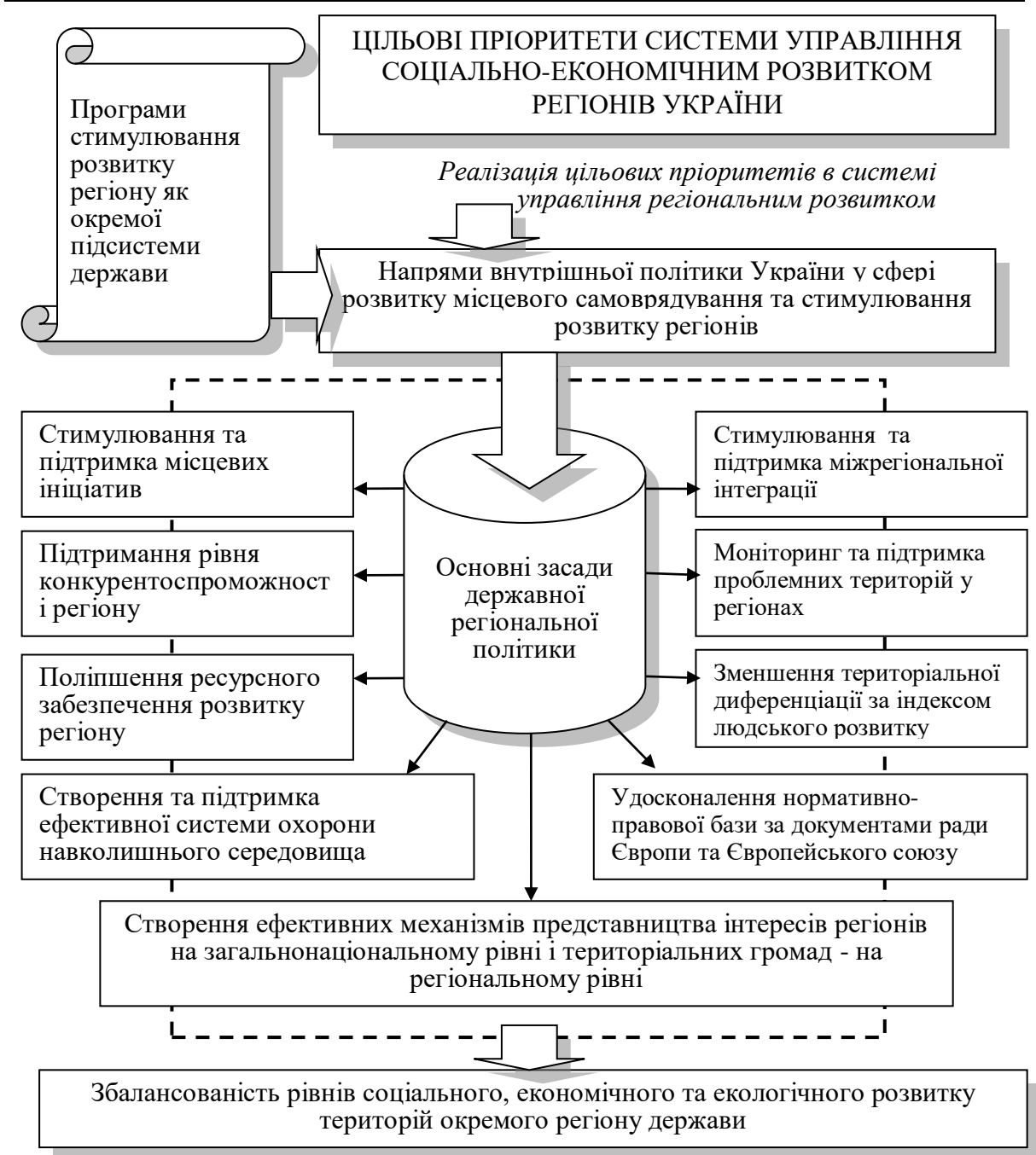
Рис. 1. Схема реалізації цільових пріоритетів системи управління соціально-економічним розвитком регіонів