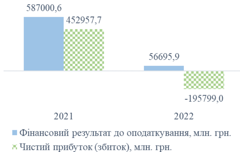
Рисунок 3. Динаміка показників діяльності суб'єктів підприємництва за січень-вересень 2021 року та січень-вересень 2022 року

суб'єктів великого та середнього підприємництва до оподаткування, у порівнянні з показниками аналогічного періоду 2021 року, знизилися більш ніж в 10 разів. Вперше за останні роки, у зазначеному періоді, в сукупності за всіма видами економічної діяльності було досягнуто збитку. Його розмір фактично склав 196 млрд. грн. (рис. 3).