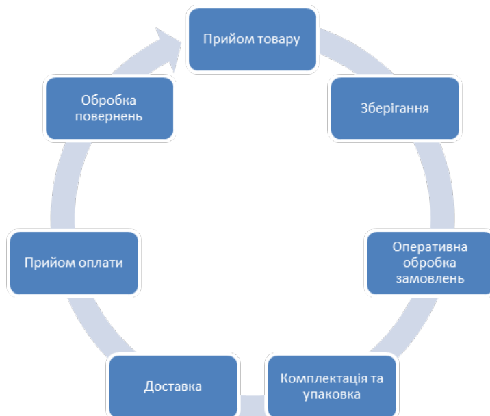
Рис. 2. Циклова схема організації руху товару в умовах фулфілмент-компанії

Нами пропонується класифікувати послуги фулфілмент-компанії наступним чином.