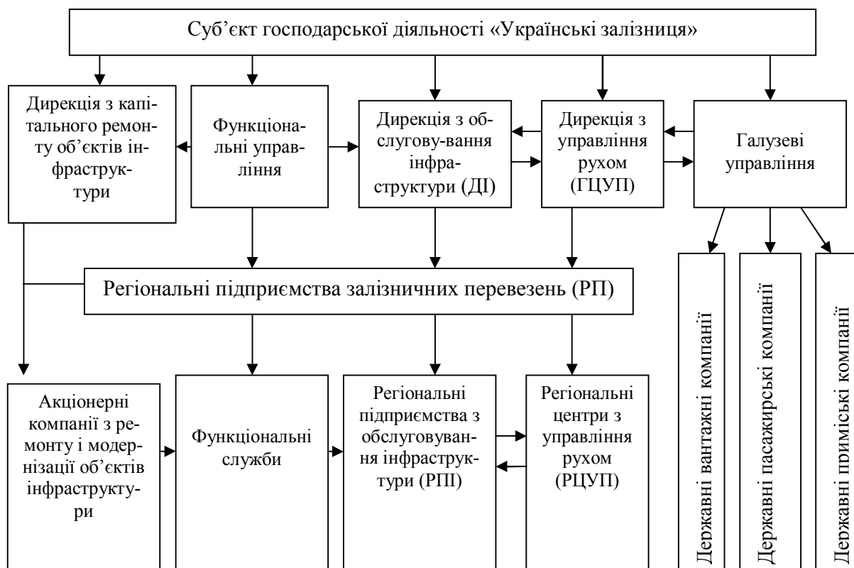
Рис. 2. Організаційна структура залізниць країни функціонально – об'єктної системи управління