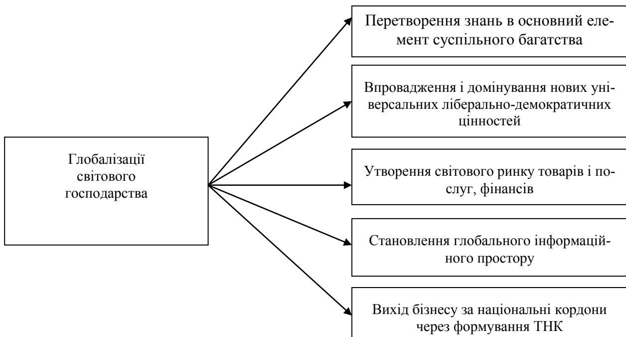
Рис. 2. Прояв глобалізаційних процесів у світовій економіці

Посилення взаємозв'язків національних економік країн світу виражається у різних економічних процесах (рис. 2).