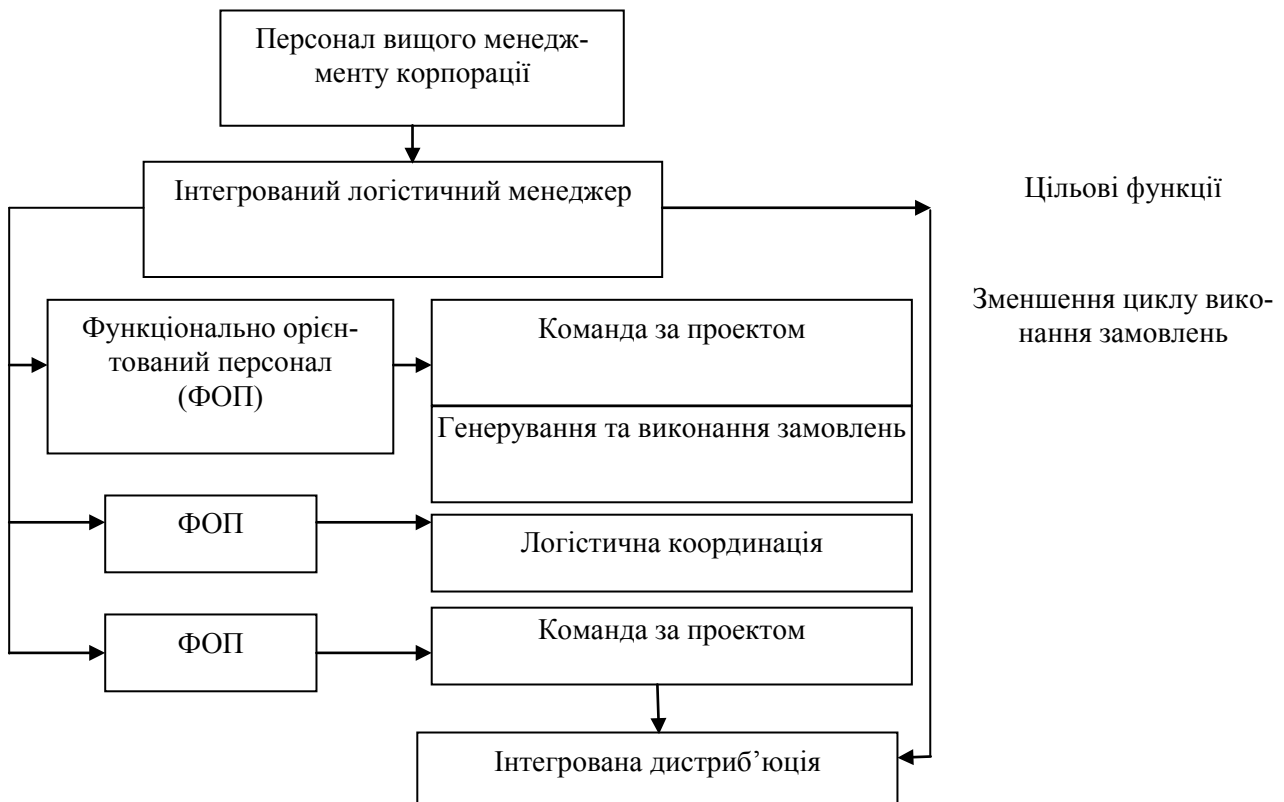
Рис. 4. Децентралізована програмно орієнтована організаційна структура логістичної служби залізничної корпорації