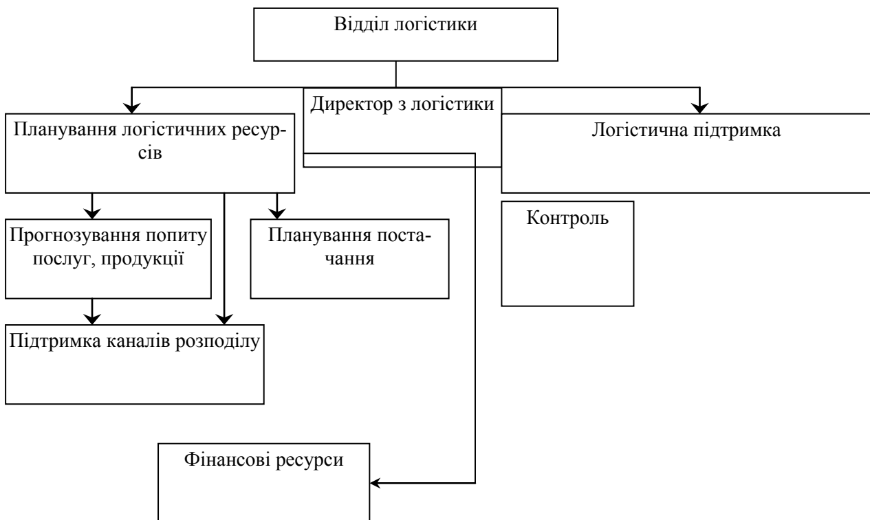
Рис. 3. Організаційна структура служби логістики залізничної корпорації [1, 2].

корпорації параметрів, пов'язаних з обсягом закупівель, терміном постачань, асортиментом продукції, пріоритетністю окремих брендів, наявністю на складах необхідних товарних запасів, рівнем якості й обсягом послуг, що надаються клієнтам, необхідно створити службу логістики. Як показує практика формування логістики в окремих корпораціях далекого та близького зарубіжжя, на перших стадіях доцільним є впровадження організаційної структури управління з логістики (для великих структур), рис. 3 [4].