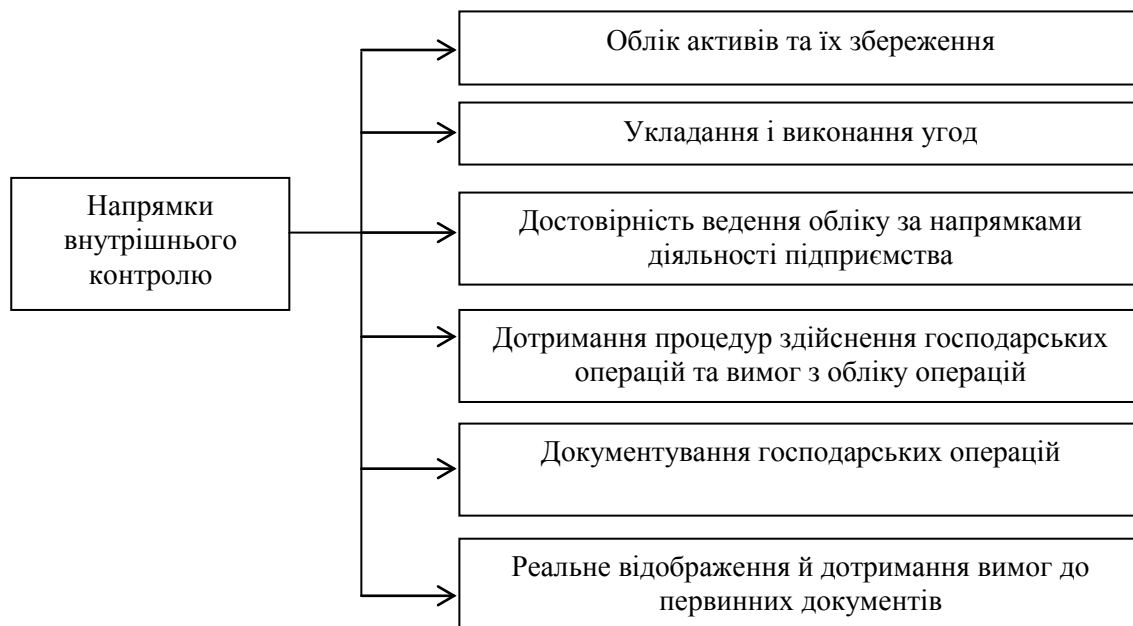
Рис. 1. Основні напрями внутрішнього контролю [14]

Основні напрями внутрішнього контролю зображено у вигляді такої схеми (рис.1).